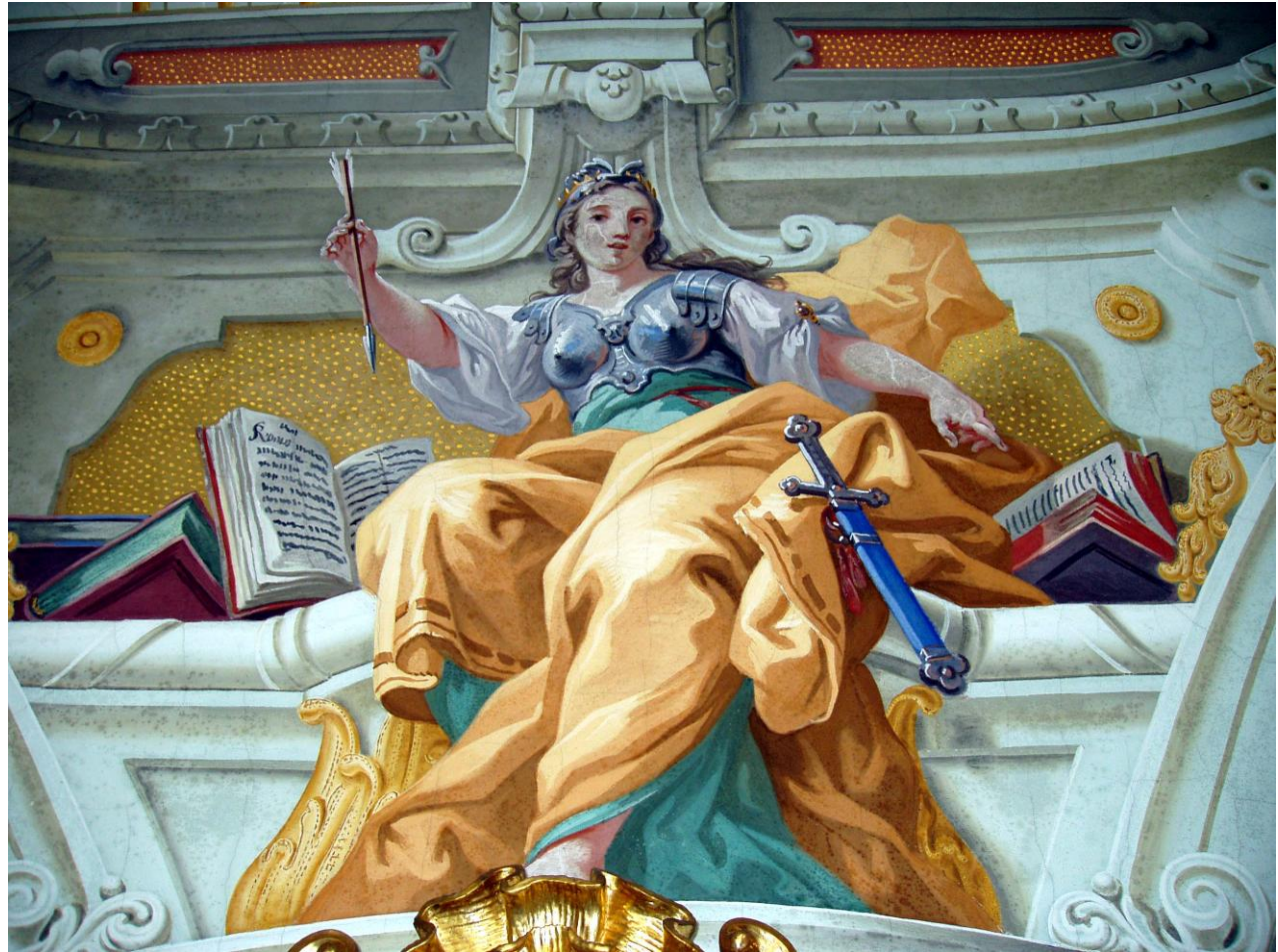
Pani Retoryka fresk z Sankt Florian, Bartolomeo Altomonte (1747)