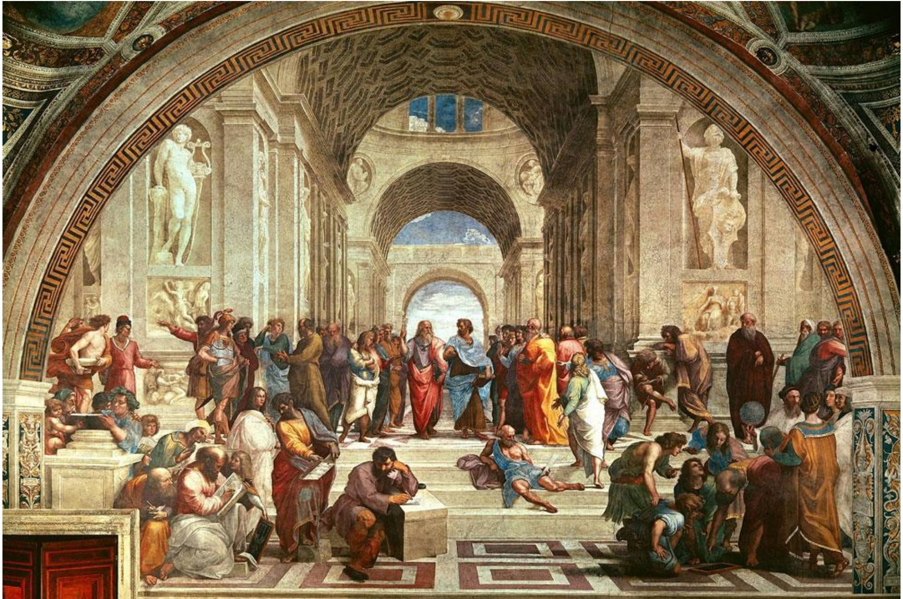
Rafael, Szkoła ateńska